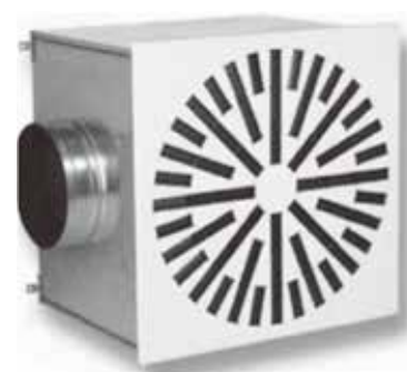
Na slici VPD-B 600x24-PL